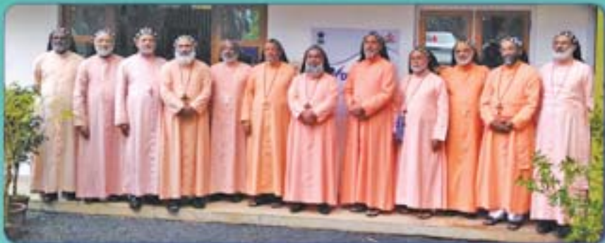
മലങ്കര സുറിയാനി കത്തോലിക്കാ സഭയുടെ 20-ാം പരിഭ്രമ ഏഷിസ്കോപ്പൽ സുന്നഹദോസിൽ പങ്കെടുത്ത അഭിവന്ദ്യ മെത്രാപ്പോലീത്തമാർ അത്യഭിവന്ദ്യ കാതോലിക്കാബാവா തിരുമേനിയോടൊപ്പം (17-09-2016, പുത്തൂർ)