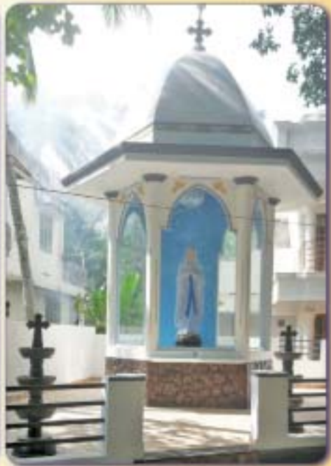
അത്യരിവന്ദ്യ കാതോലിക്കാബാവ തിരുമേനി കൂടാതെ ചെമ്പ്ത കാട്ടുനീള (കാട്ടാക്കട ഖൈദികമില്ല) ചലകര സുറിയാനി കത്തോലിക്കാ റൈവാലയവും പരി. ലൂർദ്ദ് മാതാവിന്റെ നാമത്തിൽ സ്ഥാപിതമായ കുരിശുടിയും (28-09-2016).