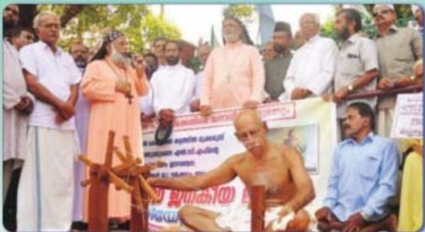
മുഖ്യമന്ത്രിയുടെ അദ്ധ്യക്ഷതയിൽ സെക്രട്ടറിയേറ്റിനു മുന്നിൽ സംഘടിപ്പിച്ച ധർമ്മ അത്യഭിവന്ദ്യ കാതോലിക്കാബാവാ തിരുമേനീ ഉദ്ഘാടനം ചെയ്യുന്നു. (26-09-2016)