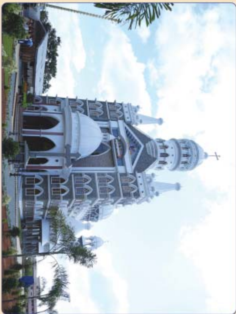
2016 സെപ്റ്റംബർ മാസം 20 - 30 തീയതി അത്യഭിവന്ദ്യ കാന്യാലിക്കാബാസാ തിരുവെന്തി മുണ്ടൻ കൂട്ടായ ചെൽവ ബന്ദോലി ദ്വാരാണ കത്തിട്രയൻ വൈവാചകം.