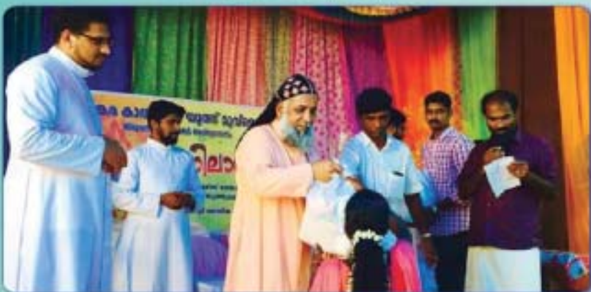
എം. സി. മൈ. എം. തിരുവനന്തപുരം രേഖൽ അതിവ്രാതനസമിതിയുടെ ഓണാഘോഷ പരിപാടികൾ അത്യഭിവന്ദ്യ കാതോലിക്കാബാവാ തിരുമേനീ ഓണക്കിറ്റ് നൽകി ഉദ്ഘാടനം ചെയ്യുന്നു. (12-09-2016, തട്ടത്തുമല)