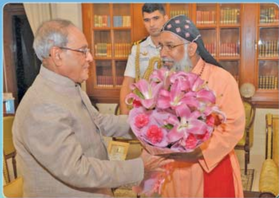
അത്യന്തവന്യ കാതോലിക്കാബന്ധുവായി ഭാരതത്തിൽ സന്ദർശിച്ച സഭയിലെ അദ്ധ്യക്ഷൻ, അദ്ധ്യക്ഷൻ ശ്രീ. പ്രണവ് മുഖർജിയുമായി കൂടിക്കാഴ്ച നടത്തിയപ്പോൾ (ന്യൂഡൽഹി, 12-08-2016)